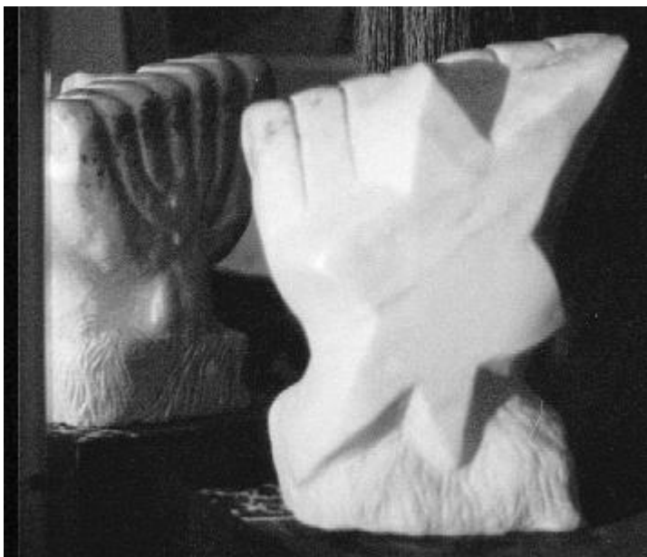
"A mon père" Menorah étoilée -Prix Neuman 1987 - Collection Musée d'Art juif de Paris

2012 : Livret Kooken référencé et conservé à la Bibliothèque Kandinsky du Centre Pompidou